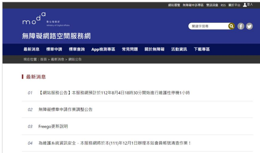
圖 10 數位發展部「無障礙網路空間服務網」 7

為推動資訊無障礙，通傳會於106年2月15日修正發布「各級政府機關機構與學校網站無障礙化檢測及認證標章核發辦法」，並訂定發布「網站無障礙規範2.0版」。因應111年8月27日數位發展部成立，無障礙網頁業務移由數位發展部數位政府司主責，每年滾動式調整網頁檢測稽核碼及檢測軟體功能，並持續開發無障礙網站設計之數位課程教材，放置於「無障礙網路空間服務網」(網址： https://accessibility.moda.gov.tw/ ) 影片專區，供全民下載使用觀看。