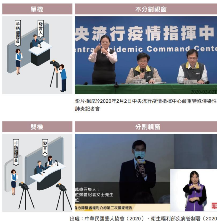
圖 9 衛生福利部社會及家庭署公告之身心障礙者融合式會議及活動參考指引 6

依據各家無線電視台填報113年度執行情形，無線電視業者於轉播總統副總統就職典禮、國慶典禮等重大典禮，或於播報政府機關發布重大緊急訊息等活動時，均參考建議規範製作，預先進行畫面配置調整，並保留手語翻譯員畫面。