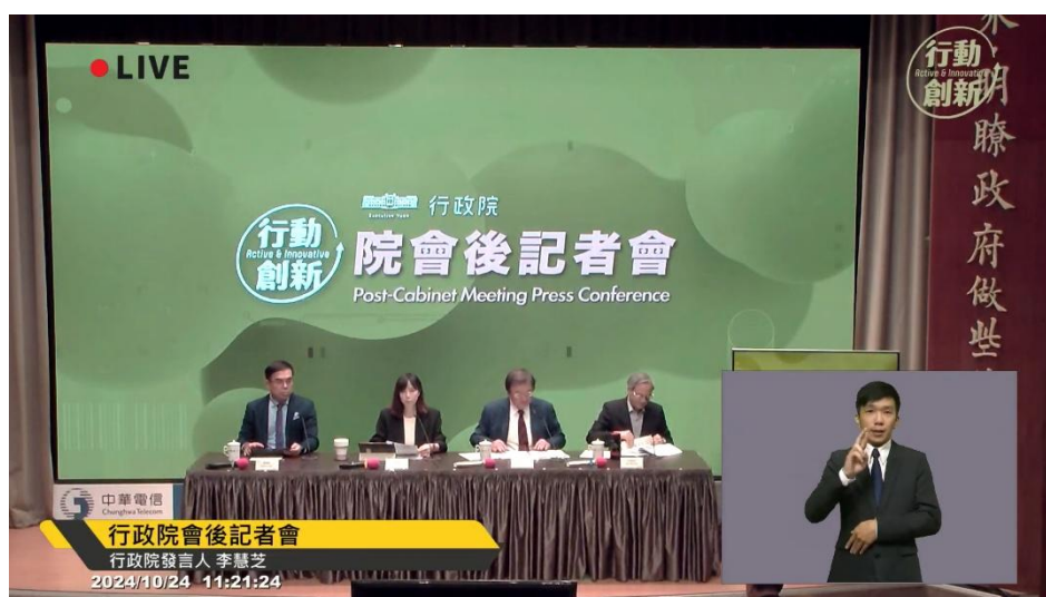
圖 6 行政院會後記者會網路直播服務提供手語翻譯服務 3

於每週四行政院會後，上載議案新聞稿及簡報檔供聽覺障礙者閱讀，以了解政府重大政策，共約149則，並於院會後記者會網路直播服務中，提供手語翻譯服務，協助聽覺障礙者接收最新政策資訊，共計49場。