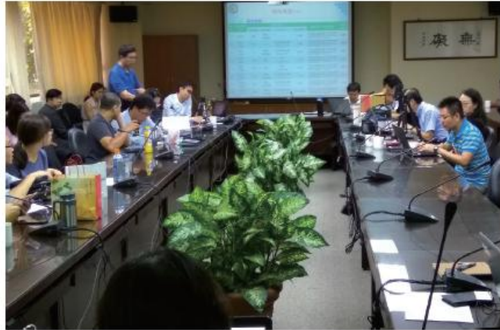
圖 5 通傳會督導業者進行災防告警訊息演練