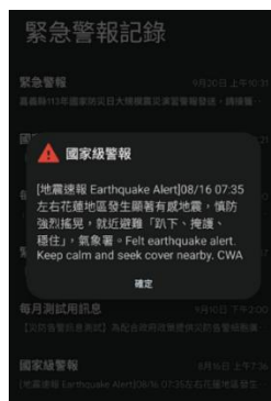
圖 3 災防告警細胞廣播訊息

我國災防告警系統業由行政院災害防救辦公室跨部會協調完成建置，為政府「防救災雲端計畫」之一，除提供各部會、各縣市政府發送災防告警訊息外，諸如台灣中油、台電公司及自來水公司等，亦可利用災防告警系統發送訊息服務；以地震速報為例，當地震預警系統預估發生規模5.0以上地震，針對預估震度可能達4級以上的縣市民眾；或預估發生規模達6.5以上地震，且預估震度可能達3級以上的縣市民眾，交通部中央氣象署會在第一時間發布強震即時警報，透過災防告警系統提醒相關區域之民眾注意防範。