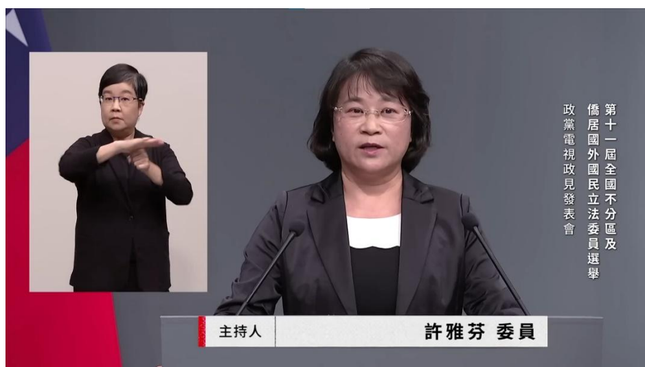
圖7 「第11屆立法委員選舉候選人電視政見發表會」提供手語翻譯服務 4

「第11屆立法委員選舉候選人電視政見發表會」於113年1月3日至同年12日期間舉辦，其中「區域立法委員選舉候選人電視政見發表會」由直轄市、縣（市）選舉委員會舉辦，共計辦理76場次政見發表會及5場次辯論會，而「原住民立法委員選舉電視政見發表會」由中選會於113年1月5日舉辦2場次，又「全國不分區及僑居國外國民立法委員選舉政黨電視政見發表會」由中選會於113年1月8日舉辦1場次，上開各場次電視政見發表會均提供手語翻譯服務，且手語翻譯員視窗為電視畫面三分之一。