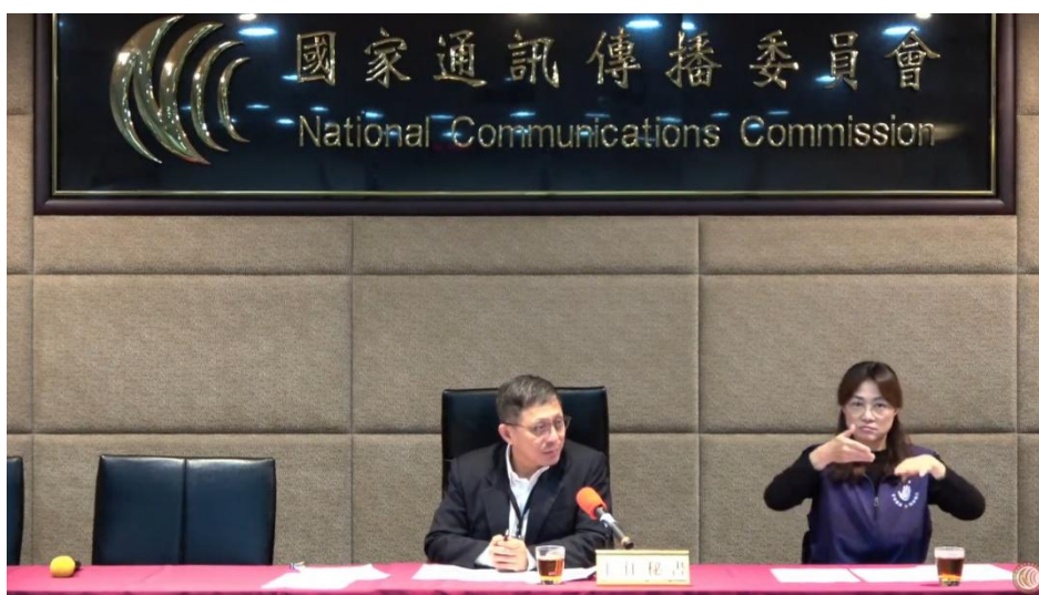
圖 8 通傳會委員會議後例行記者會提供手語翻譯服務 5